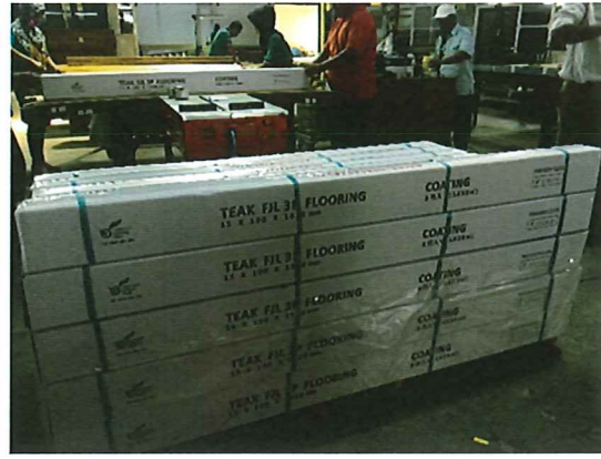
※現地スラバヤにて